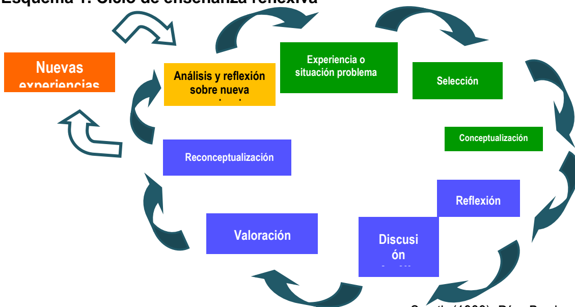
Esquema 1. Ciclo de enseñanza reflexiva

Smyth (1989), Díaz Barriga (2002), Reed y Bergemann (2001), Schön (1992) (En