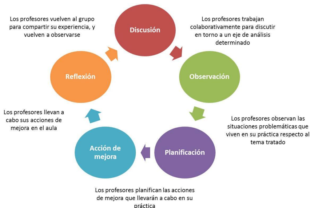
Esquema del ciclo de mejora

En general esta estrategia metodológica persigue dos finalidades, una es mejorar las prácticas docentes, y otra mayormente ambiciosa, es crear un ambiente de colegialidad y evaluación continua que profesionalice la docencia y disminuya la dependencia de asesores externos.